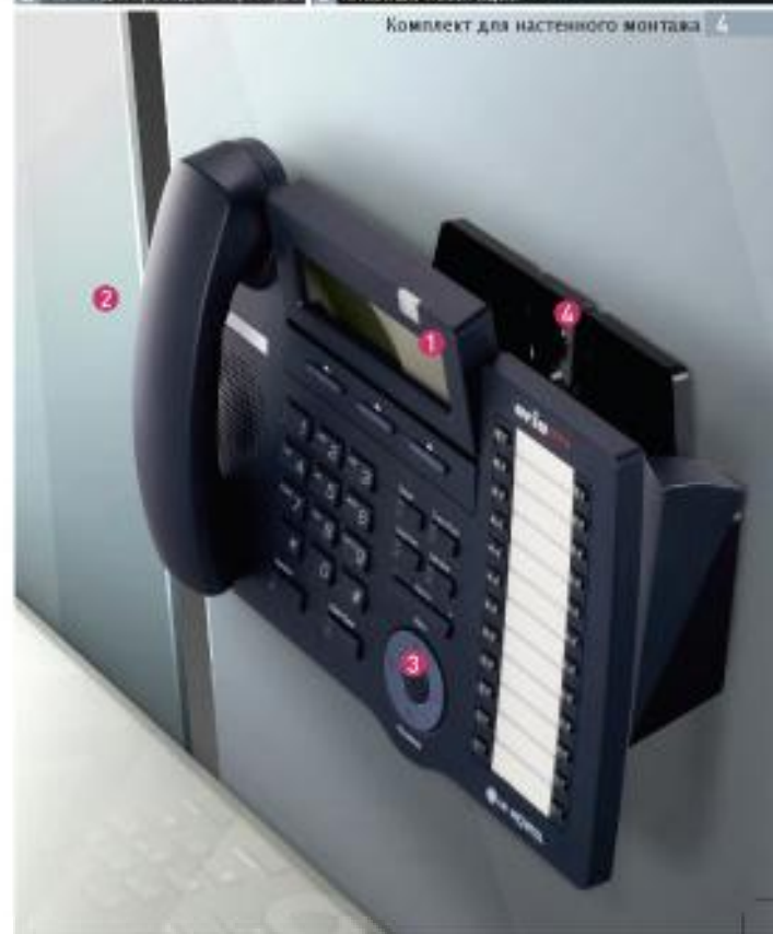
Комплект для настенного монтажа 4