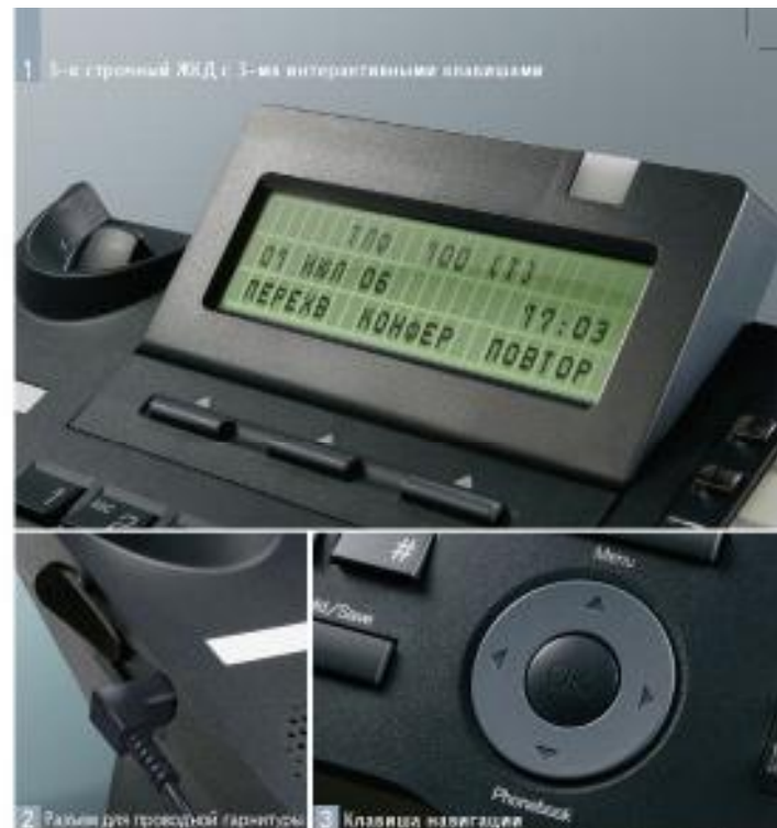
2 Разъем для проводной гарнитуры