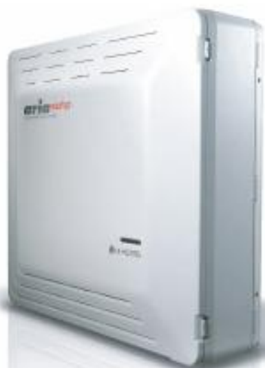
ОПТИМАЛЬНЫЕ функции для общения